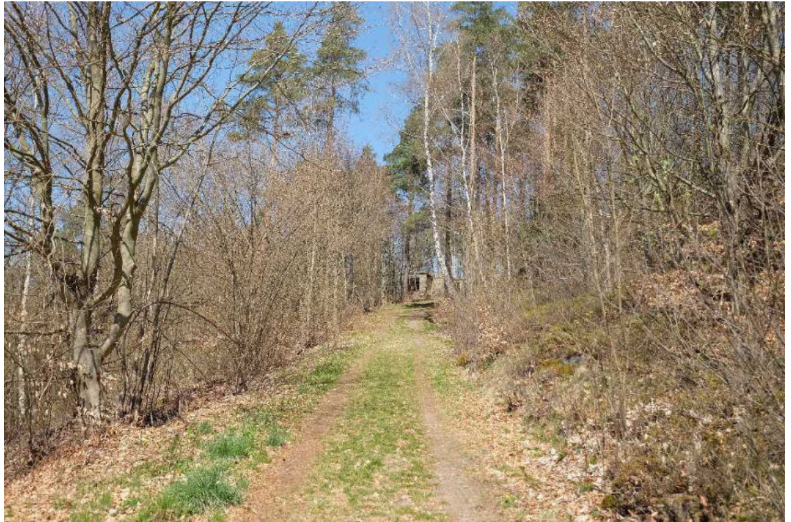
Abb.: Forstweg (von Hans-Birk-Straße kommend) mit Blick auf die Südfassade des Steinhauerhauses

Der vorbe laufende Forstweg ist über die Hans-Birk-Straße zu erreichen.