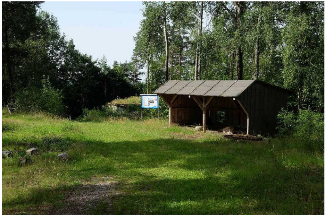
Abb.: Nordansicht auf das kleine Holzgebäude und die Nordfassade des Steinhauerhauses. Die dort befindliche Fläche kann als Material- lagerfläche genutzt werden.

Die Benutzung des Wanderweges muss gewährleistet bleiben.