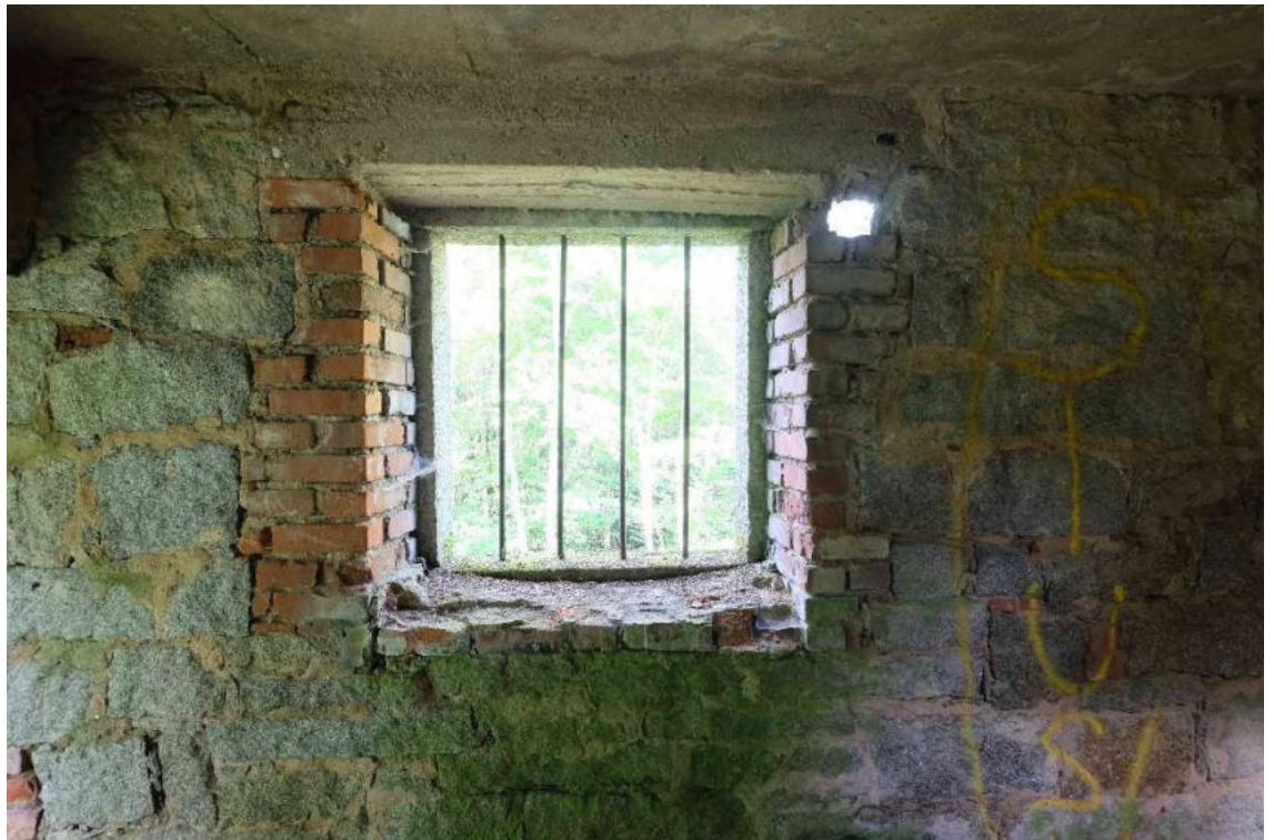
Abb.: bestehende Vergitterung